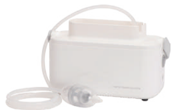
mama hanamizu totte